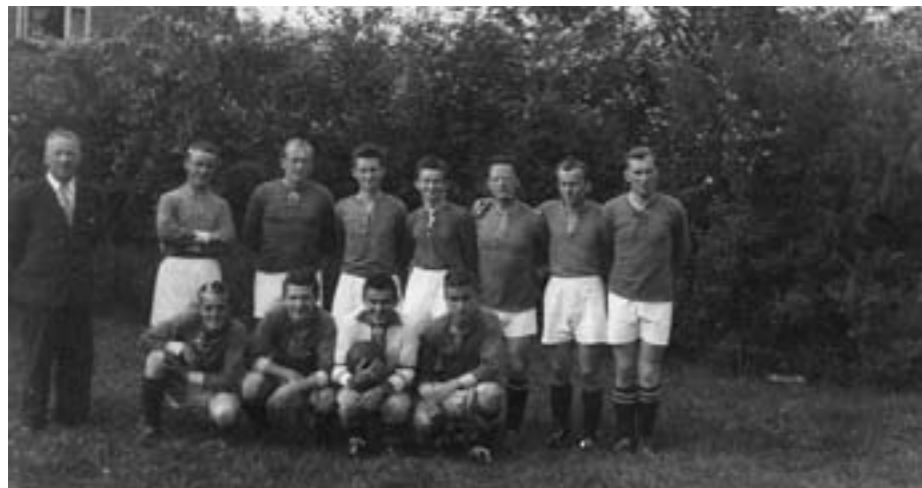
Prvoligové mužstvo Kladna hrálo v Rychnově při příležitosti slavnostního otevření celého hřiště

I v tomto roce se pracovalo na rozšíření hrací plochy. Vydáním pomocníkem se stal výkonnější buldozer, který zajistilo vedení místní mlékárny. Odvoz a přemísťování zeminy zabezpečovalo svými dopravními prostředky zemědělské družstvo. Oddíl začal spolupracovat s fotbalovým klubem SK Křinec. Ke slavnostnímu otevření celého hřiště si pozval oddíl tehdejší prvoligové družstvo Kladna.